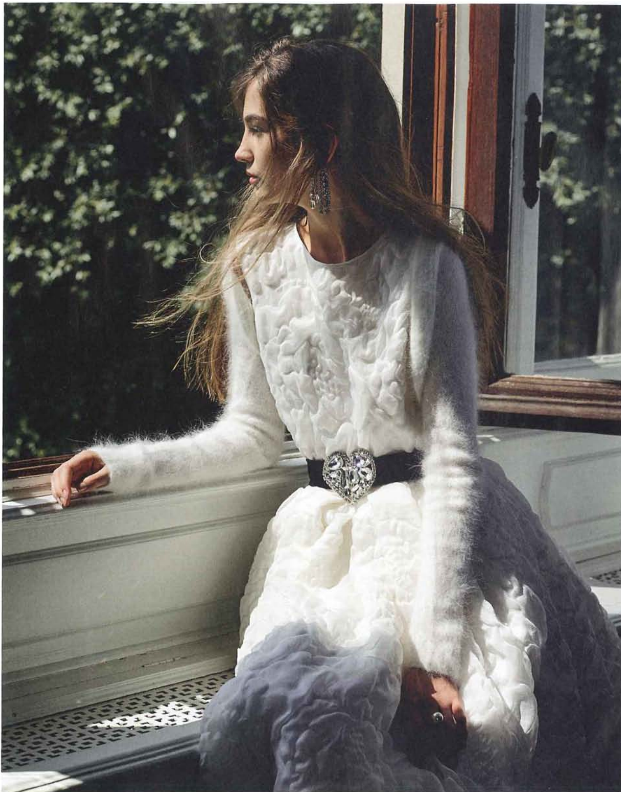
Abito in organza di seta e lino con gonna svasata dal motivo a onde e coprispalle in angora MaxMara Bridal . Cintura in velluto con cuore prezioso Alessandra Rich . Orecchini pendenti con cristalli Sharra Pagano . Pagina accanto. Abito in tessuto gofrato con corpino ricamato e cintura in tulle Antonio Riva .